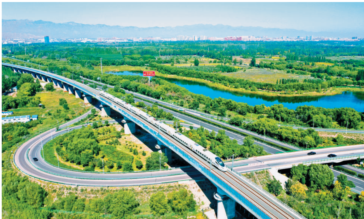
宁夏迈入“高铁时代”

绿水青山就是金山银山。党的十八大以来,宁夏按照习近平总书记“生态环境保护建设要持之以恒”的重要指示精神,坚决不要发臭的GDP,顶住经济下行压力,大抓山水林田湖草沙综合治理,坚决整治黄河“四乱”和腾格里沙漠污染、星海湖生态环境问题,污染防治按下“快捷键”,绿色发展步入“快车道”。森林覆盖率从11.9%提高到16.9%,地级市空气优良天数比例连续6年保持在80%以上,黄河干流宁夏段水质连续5年保持Ⅱ类