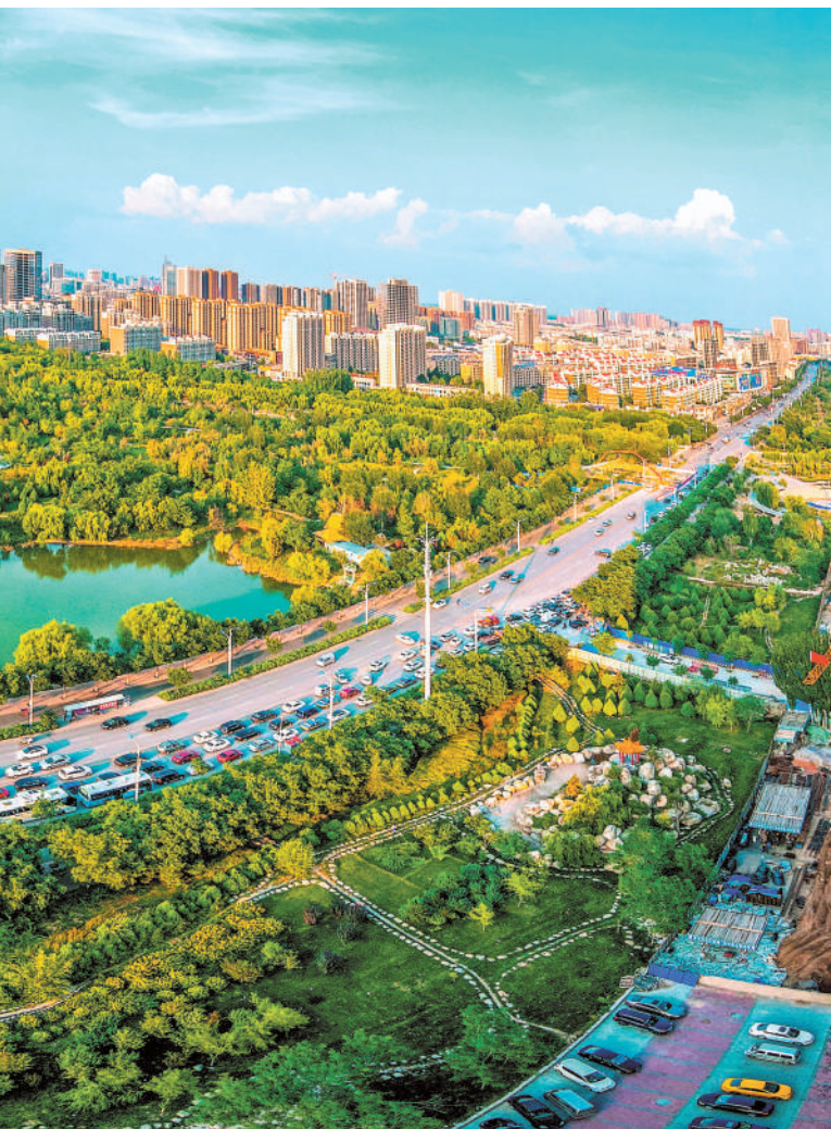
塞上江南越来越美。图为银川市宝湖公园全景。

26年前,时任福建省委副书记的习近平,亲自谋划、带头主抓,倾情推进闽宁对口扶贫协作。1997年4月,习近平同志第一次来到宁夏,用4天时间走遍了西海固地区。在随后的6年时间里,他5次参加闽宁对口扶贫协作联席会议、3次发表重要讲话,创造性、系统性提出并推动形成了闽宁对口扶贫协作机制,亲自提议并命名“闽宁镇”,闽宁两省区因此结下了“山海情”。到中央工作以后,习近平总书记始终牵挂着宁夏人民,2008年4月再次来到宁夏进行了3天视察调研。2016年7月18日,习近平总书记第三次踏上宁夏这片热土,向全党发出了“社会主义是干出来的”“走好新的长征路”的伟大号召,为宁夏指明了“努力实现经济繁荣、民族团结、环境优美、人民富裕,确保与全国同